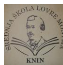
Srednja škola Lovre Montija