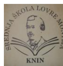
Srednja škola Lovre Montija